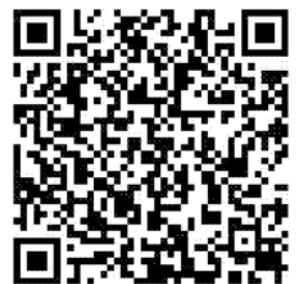
▲報名表 QR code